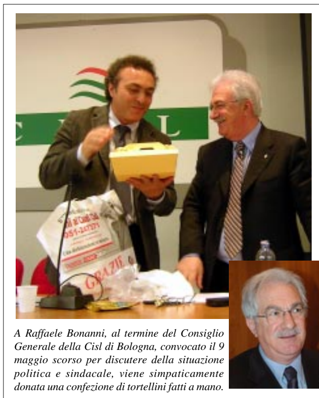
A Raffaele Bonanni, al termine del Consiglio Generale della Cisl di Bologna, convocato il 9 maggio scorso per discutere della situazione politica e sindacale, viene simpaticamente donata una confezione di tortellini fatti a mano.

Giovedì 27 aprile con un consenso di oltre 90%, Raffaele Bonanni è stato eletto nuovo Segretario generale della Cisl. Bonanni ha iniziato la sua attività sindacale in Abruzzo e dopo aver frequentato il Corso lungo al Centro Studi ha guidato la Cisl di Palermo, la Cisl Siciliana, e la Filca Nazionale. Conosciamo Raffaele da anni per il suo impegno serio e rigoroso e per il suo attaccamento all'organizzazione. Bonanni ha partecipato alla nostra Assemblea Organizzativa nel 2003 e sarà presente al nostro Consiglio Generale del 9 maggio. Tutta la Cisl bolognese fa i migliori auguri al nuovo Segretario della Cisl.