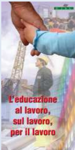
XVI Congresso Territoriale CISL

L' educazione a tutti i livelli, elemento che qualifica la vita personale e sociale e che da alla comunità quei valori fondamentali del rispetto, dell'impegno, dell'attenzione verso l'altro, fondamentali per il raggiungimento del bene comune. L'educazione che deve entrare anche nella riflessione sul lavoro. Spesso i giovani non sono educati alle sfide e alle responsabilità in materia lavorativa; non conoscono le regole, le modalità gli approcci. Ma anche quando si entra nel mondo del lavoro è necessario educarsi ad un nuovo mondo che si apre: quello delle regole del rapporto con gli altri, del rispetto nelle rispettive responsabilità.