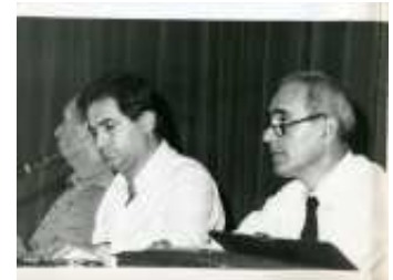
Alcune foto dall'Archivio storico CISL