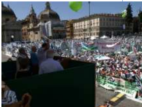
Momenti della manifestazione nazionale dei Pensionati CISL dell'11 giugno in Piazza del Popolo a Roma

Abbiamo rivendicato l'approvazione di una legge quadro nazionale strutturale sulla non autosufficienza che tuteli le famiglie che hanno in caso una persona, giovane o anziana che sia, diversamente abile i cui costi sono diventati insostenibili. Nel 2010 non sono previste risorse per la non autosufficienza, chiediamo quindi che